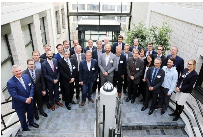
Bild 1: Partner aus Industrie und Wissenschaft trafen sich am 14.11.2017 zum Kick-off des Fraunhofer-Fokusprojekts futureAM in Aachen.