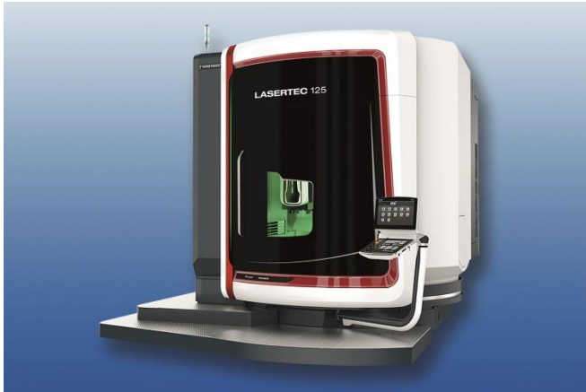
Bild 2: Die im Projekt eVerest entwickelte Technologie erlaubt eine bis zu dreifach schnellere Bearbeitung in einem vollautomatisierbaren 8-Achssystem.