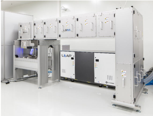
Bild 2: Ab sofort steht am Fraunhofer ILT ein neues Excimerlaser-System für die Verfahrensentwicklung bei der Mikrobearbeitung von Oberflächen zur Verfügung.

----- PRESSEINFORMATION 05. Juli 2018 || Seite 3 | 3 -----