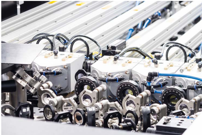
Bild 2: Kohärent kombinierter UKP- Faserlaser der kW-Klasse, wie er am Fraunhofer IOF in der User Facility bereitgestellt wird.

PRESSEINFORMATION 4. Juli 2018 || Seite 3 | 4