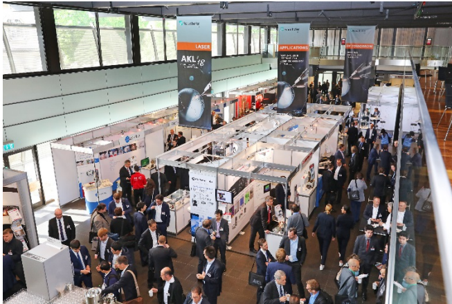
Bild 3: Plattform für lebhaft Diskussionen: 56 namhafte Hersteller von Lasersystemen und - komponenten präsentierten sich auf der konferenzbegleitenden Sponsorenausstellung des AKL'18.

PRESSEINFORMATION 16. Mai 2018 || Seite 7 | 9