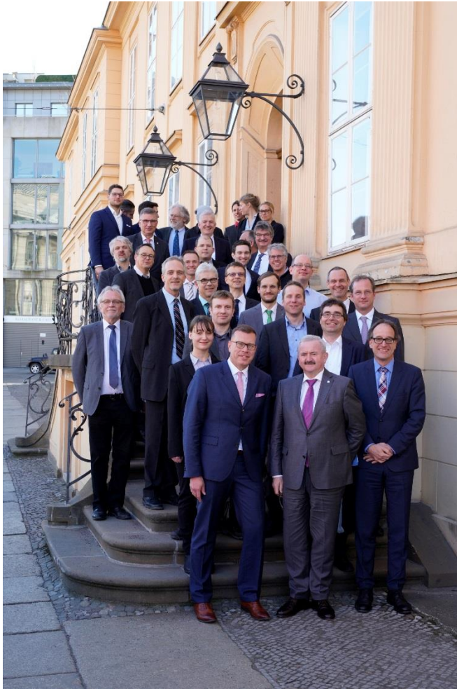
Bild 2: Fraunhofer-Präsident Prof. Reimund Neugebauer (1. Reihe Mitte) und die Konsortialpartner des Fraunhofer-Leitprojekts QUILT.

----- PRESSEINFORMATION 24. April 2018 || Seite 4 | 4 -----